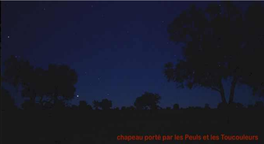
chapeau porté par les Peuls et les Toucouleurs